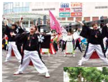
熱気あふれる演舞

高知県のよさこい踊りと北海道民謡ソーラン節が融合し誕生したのが「よさこいソーラン祭り」。新型コロナの影響などで5年ぶりの開催となりましたが、駅前会場と流し踊りの2会場で披露された祭りは、参加者が表情豊かに踊った後、最後のポーズを決めると観客からは大きな拍手が送られていました。