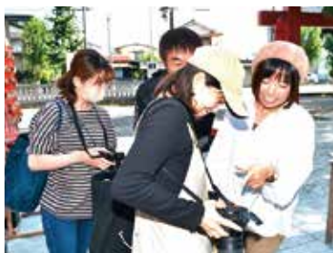
撮影した写真をアドバイス

参加者は「幼い子どもがいるので、生き生きとした表情の子どもの写真を撮影したくて参加しました」や「家に一眼レフカメラがあるのに使っていない、眠っているので、使い方を覚えたくて参加しました」など参加動機はさまざま。実際