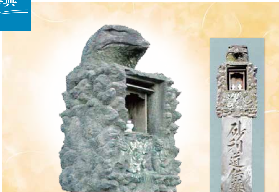
ぎょうだいさまのお顔