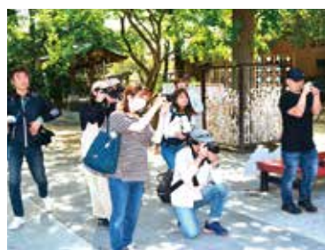
思い思いに撮影する参加者たち

にモデルを前にそれぞれカメラを構えて思い思いに撮影していました。境内は樹木も多く、人物が影になる場面もありそれぞれ苦労しながら人物撮影にチャレンジしてい